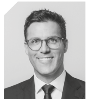
Manuel Hagel, MdL

Gleichzeitig stärken wir die Institutionen, die den Rechtsstaat tragen: Leistungsfähige Gerichte, schnelle Verfahren, klare Spezialisierungen – etwa bei Cybercrime oder komplexen Wirtschaftsverfahren –